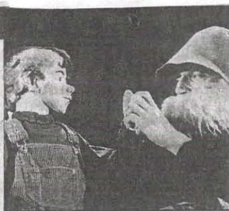
Tistou et le jardinier.